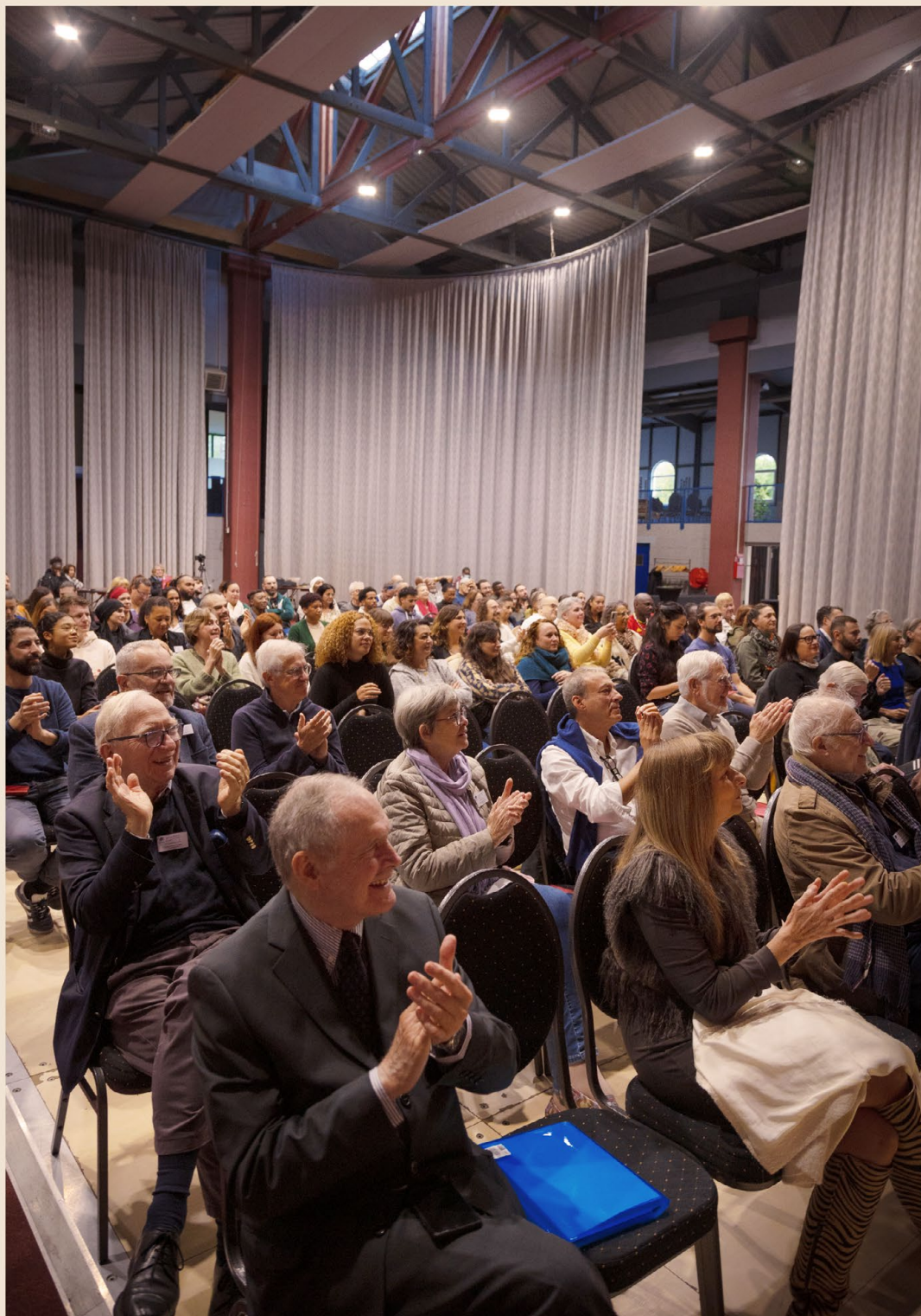
Le séminaire de l'AVVEJ 2024